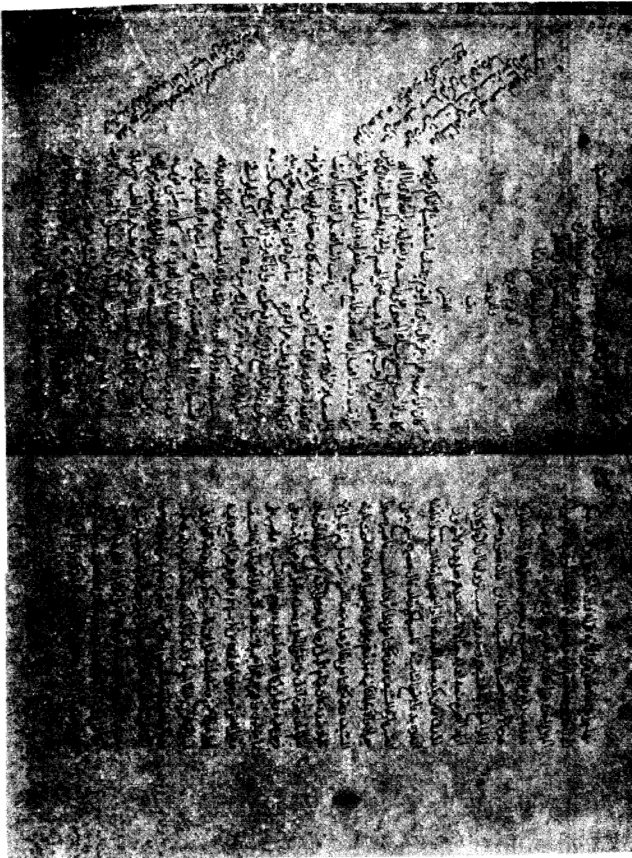
الورقة الأخرى من نسخة (ب).