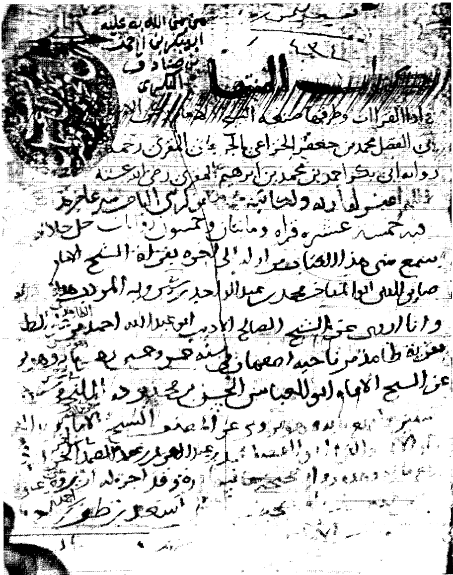
صورة الغلاف من الأصل