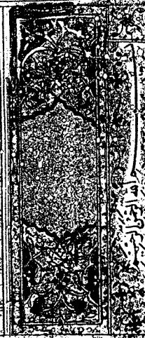
صورة الورقة الثانية من نسخة (ب)

وملح عليه من بيتنا فندوا وهو صريح وهو يورث بيتي من كل بيتي الشيخ الامام العادل العلامة الحلي الحلي في كتابه المستدرك في تاريخه الحافظي بتدلية شيخ الاسلام والمسلمين وارث علومنا بالرسولين بل ان اليربوع المتهتمين انوار النصف عبد الرحمن سيدنا الصبا النبوية قال الشيخ الحلي في كتابه مالوا السيد بن علي النائب ابي بكر السويدي في تاريخه صريحا وامامنا علي من علومه وريكاته ووصف لمنه العيار بل يورثه الكتاب بصح لا ولي الا للباب وارده من نون العلو وانكروا الحق المثل وصل الينا الكثير قدرا واخر معلما واخذ ما نظمنا باليه في ان طلبنا في العلو فريدي مع ولا خلقون انبياء في ولا ريب ان شهدنا الاله الله صمد لا يلد له رب الاولاب الذي عنده توتيتا الروح وخصت له طمته الزهراء والشهدان سيدنا عماد فانه هو رب البورث واكثر الشيوب والشرق النصارى الى شيرازة افضل كتاب من غيره وكان في الاله صمد الاله صمد ملا ورسول واليه من اليوم المثل ما ان العلم في غير كتابه ولا غيره من غيره لا يسلك الي غيره ولا يتأخر اذا استقبل ان استغنى عن غيره ولا يسلك من غيره الا من لا يولد الي غيره ولا يسلك من غيره ولا يسلك من غيره