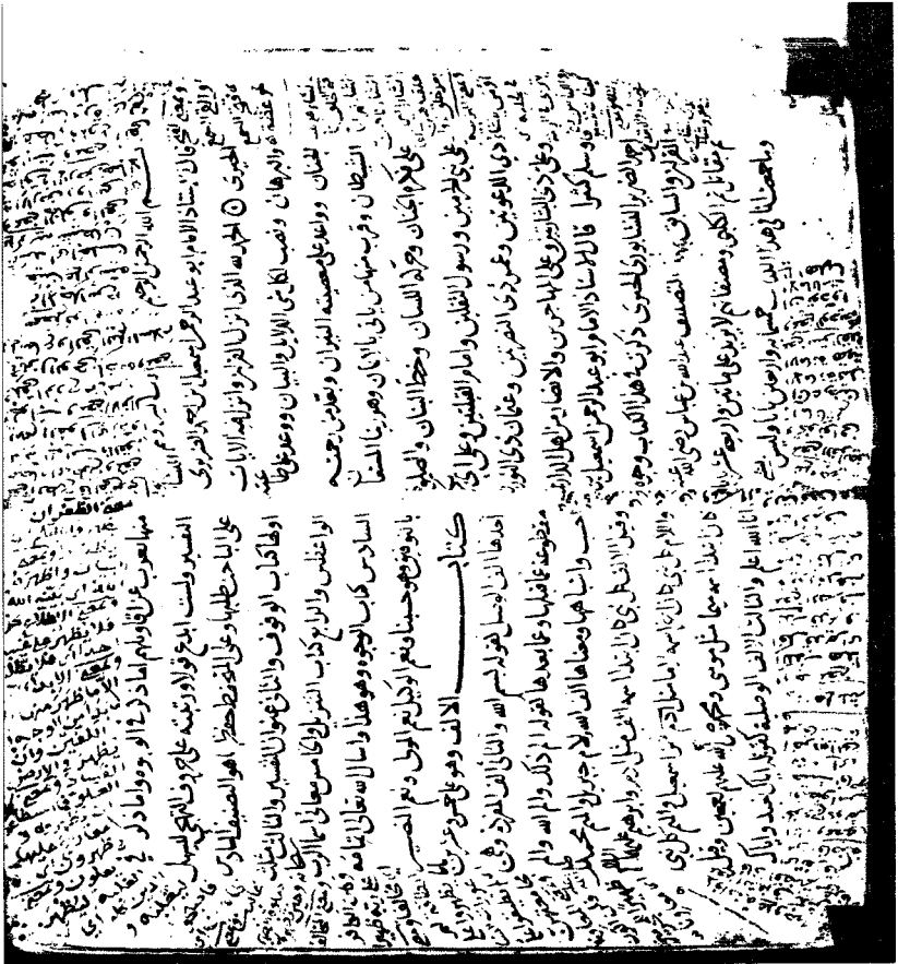
الورقة الأولى من المخطوط